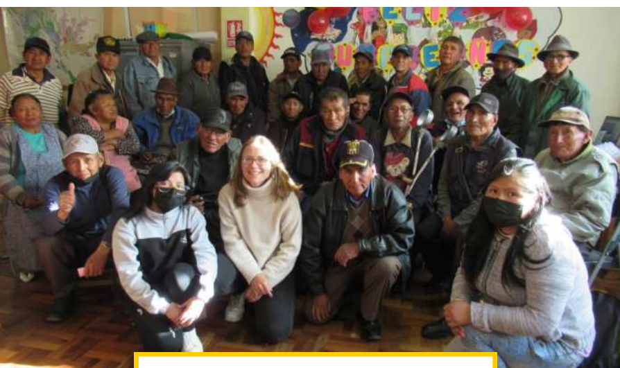
Gruppenbild mit einem Teil der Senior*innen

Da im Juli drei Wochen Winterferien waren (offiziell zwei, aber sie