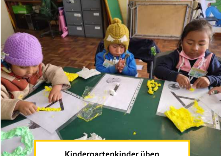
Kindergartenkinder üben erste Vokale

dergartenkinder, 74 Grundschüler*innen und 89 Schüler*innen der 7. bis 12. Klasse daran teil. In der zweiten Jahreshälfte werden noch weitere Seminare folgen, um auch diejenigen zu erreichen, die aus unterschiedlichen Gründen bisher nicht kommen konnten. Die Stimmung war sehr gut und die Kinder und Jugendlichen beteiligten sich aktiv und sehr motiviert.