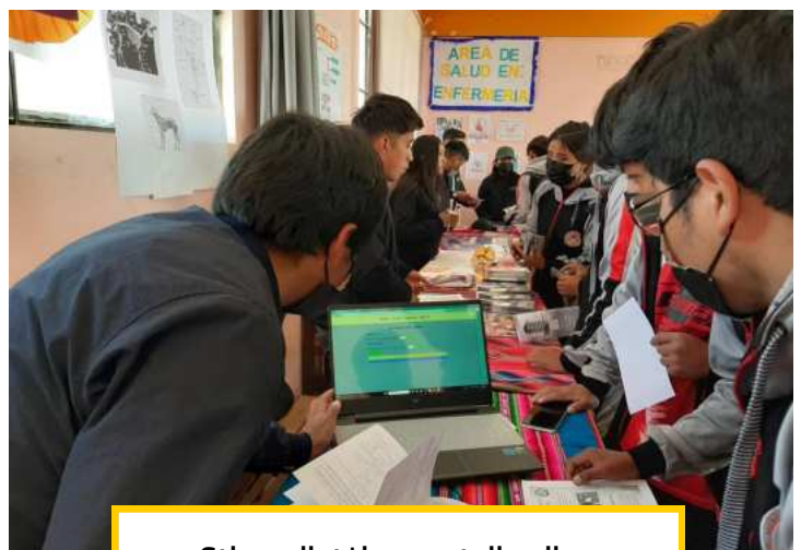
Stipendiat*innen stellen ihre Berufsbilder vor

In den ersten fünf Jahren von VAMOS JUNTOS hatten wir 38 Schuhputzer mit einem Studienstipendium unterstützt. Aktuell erhalten 26 Studierende in 21 verschiedenen Studiengängen und Ausbildungsberufen ein Stipendium, von