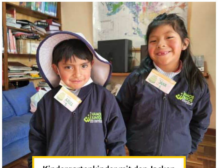
Kindergartenkinder mit den Jacken von VAMOS JUNTOS

Zu Beginn des Schuljahres hatten wir 250 Kinder und Jugendliche mit Schulmaterialien, 149 mit Schuhen und zum ersten Mal auch 246 Schüler*innen mit Jacken und Basecaps ausstatten können; Jacken zum Schutz vor der Kälte (in La Paz und El Alto liegen die Temperaturen ganzjährig morgens und abends um die Null Grad), Basecaps zum Schutz vor der starken Sonnenstrahlung auf Höhenmetern von 3500m bis 4100m. Die Freude darüber war bei den Kindern und Jugendlichen sehr groß. Das Blau der Jacke entspricht der Farbe fast aller Schuluniformen, so dass sie diese auch in den unbeheizten Schulräumen tragen können. Häufig kommen die Schüler*innen mit ihren Jacken und Kappen ins Büro, und auch auf der Straße haben wir damit schon viele angetroffen. Besonders gefreut haben wir uns darüber, dass wir auch in diesem Jahr 42 Schüler*innen für besonders gute Schulnoten (mind. 80 Punkte von 100 Punkten) auszeichnen durften, dies entspricht 24% der Schüler*innen der 1. bis 12. Klasse. Lediglich neun Kinder und Jugendliche mussten das Schuljahr wiederholen.