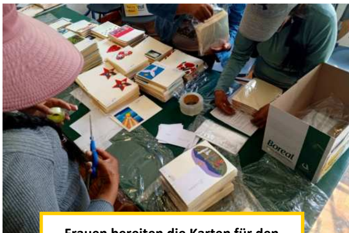
Frauen bereiten die Karten für den Versand vor