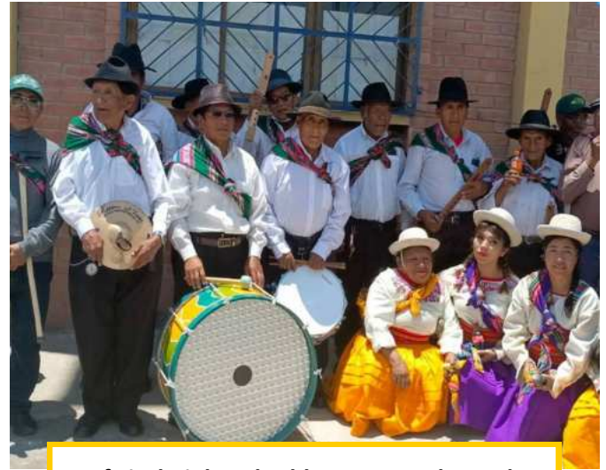
Auftritt bei der Abschlussveranstaltung der Schule Großbritannien

Die Gruppe der Senior*innen, die regelmäßig an den wöchentlichen Treffen teilnehmen, ist inzwischen auf über 60 Personen angewachsen. Dies führt dazu, dass wir mehrere Kleingruppen bilden mussten. Freitagsnachmittags treffen sich nun für dreieinhalb Stunden diejenigen, die im Anschluss an Gedächtnis- und Bewegungsübungen noch Theater spielen und tanzen. Am Samstagvormittag kommen die zusammen, die traditionelle Musik einüben und am Nachmittag teilt sich die Kleingruppe nach den gemeinsamen Übungen; die einen singen zusammen weltliche, die anderen christliche Lieder. Inzwischen hat sich das künstlerische Talent der Senior*innen herumgesprochen. In den letzten Monaten hatten sie ver-