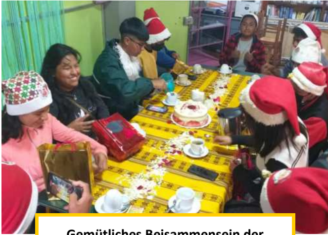
Gemütliches Beisammensein der Schulabgänger*innen

Einen wichtigen Schritt in Richtung Berufsausbildung haben unsere diesjährigen Abiturient*innen (allgemeiner Schulabschluss nach zwölf Jahren) gemacht, insgesamt zehn Kinder und zwei Enkel aus Schuhputzfamilien. Zum ersten Mal wurde dieses Jahr für sie in unseren Büroräumen eine kleine Abschlussparty gefeiert. Über Jahre hinweg hatten viele von ihnen in den Ferien unsere Work-