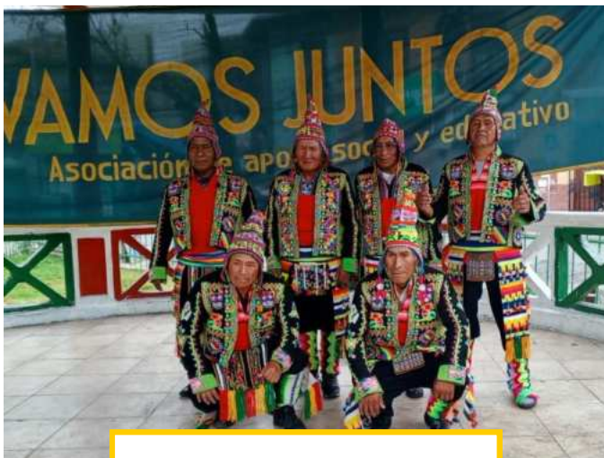
die Tanzgruppe der Senioren

schiedene Auftritte, so im August bei einem Event des Ministeriums für Gleichstellung und Chancengleichheit zum „Tag der Senior*innen“ mit etwa 250 Teilnehmenden, im September zur Begrüßung der neuen weltwärts-Freiwilligen in La Paz, im Oktober im Sonderpädagogischen Zentrum St. Francisco von Assisi sowie in der Sendung „Volks-