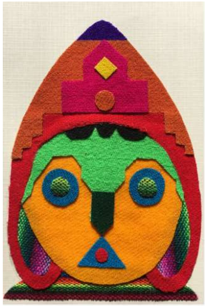
Motiv 43 Kind aus den Anden