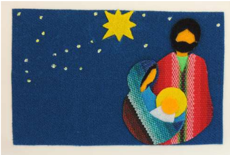
Motiv 16 Josef, Maria und Jesus