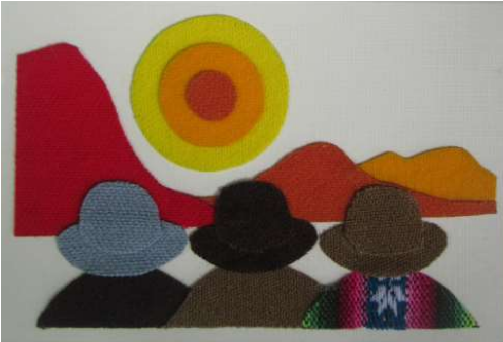
Motiv 39 Sonnenuntergang in den Anden