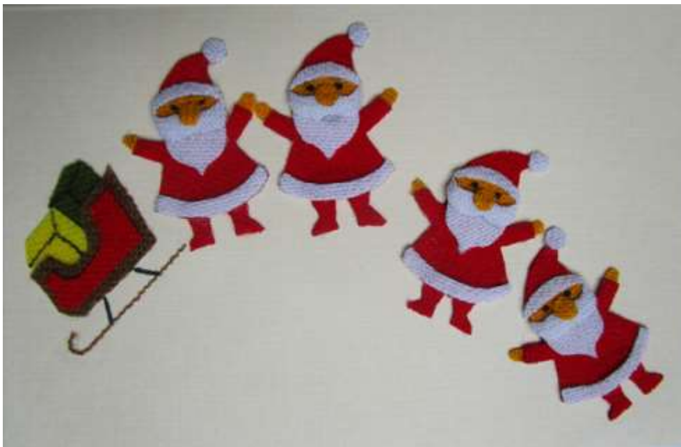
Motiv 28 Fröhliche Weih- nachtsmänner