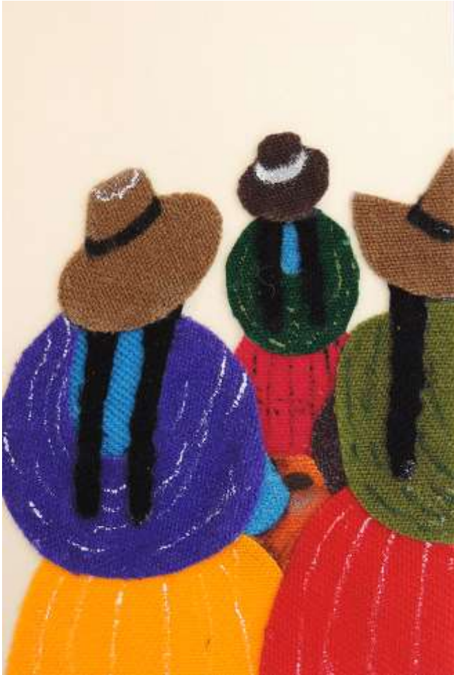
Motiv 42 Frauen