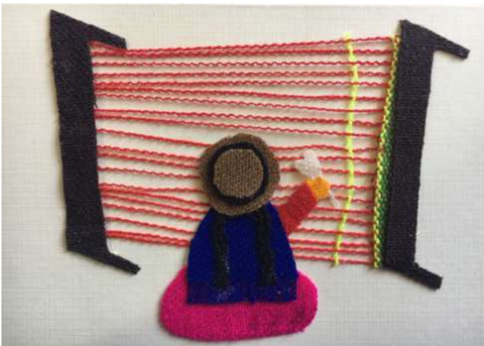
Motiv 46 Weberin