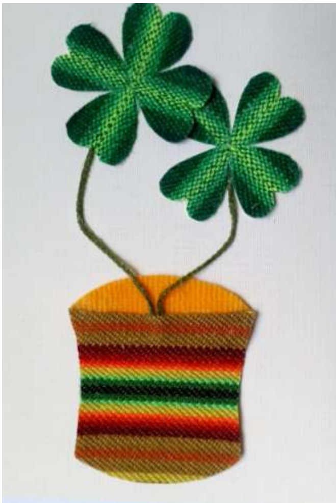
Motiv 54 Kleeblätter