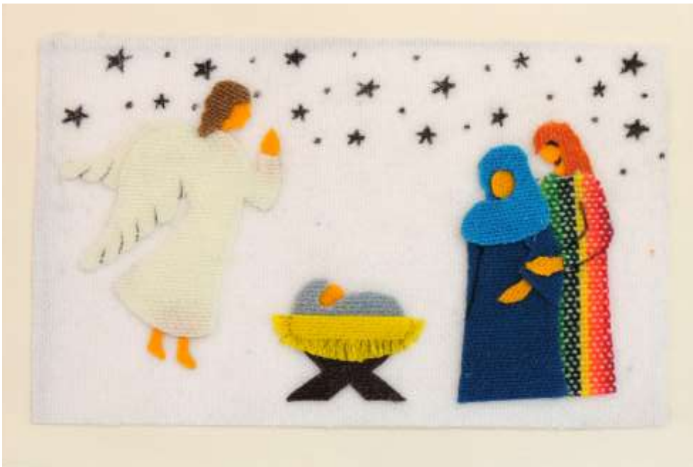
Motiv 14 Engel an der Krippe