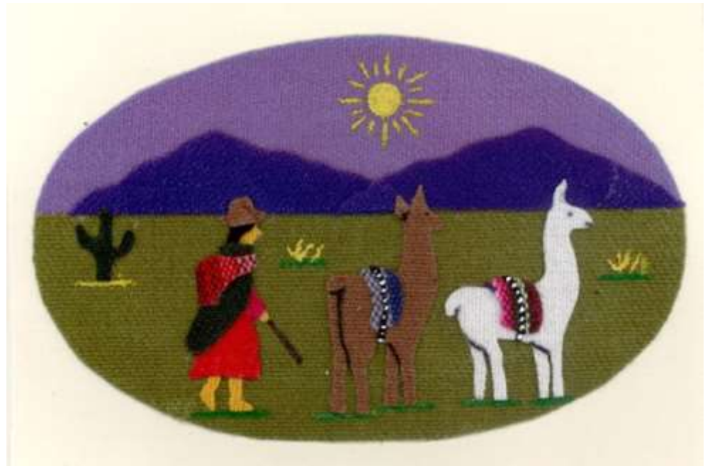
Motiv 37 Hirtin mit Lamas