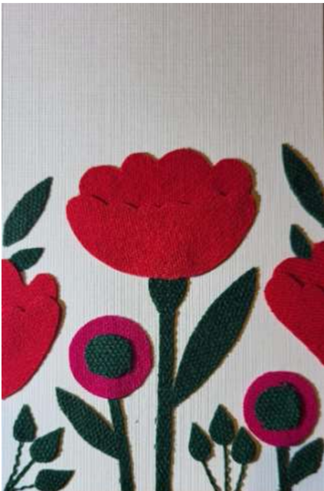
Motiv 53 Mohnblume