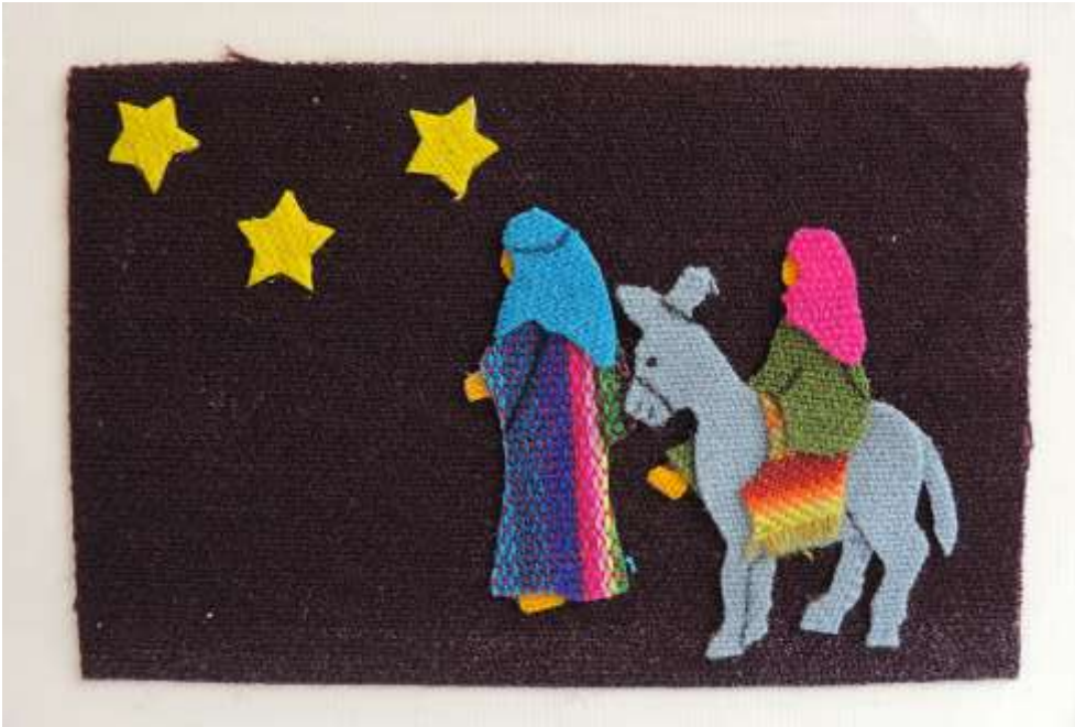
Motiv 7 Wir folgen dem Stern