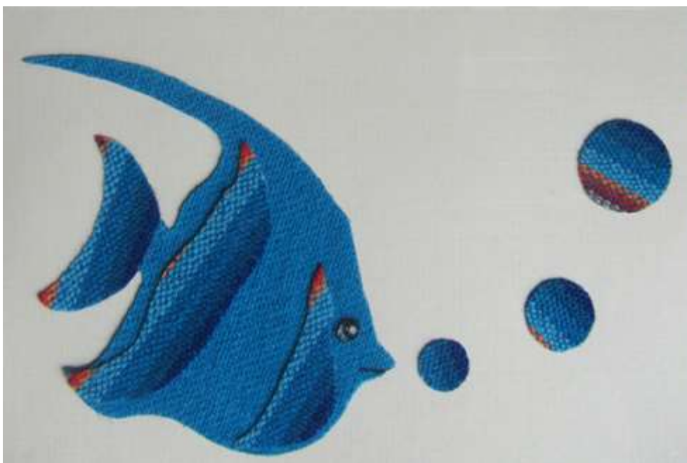
Motiv 51 Fisch