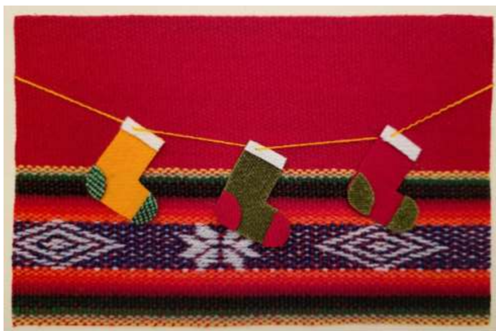
Motiv 6 Weihnachtsstiefel