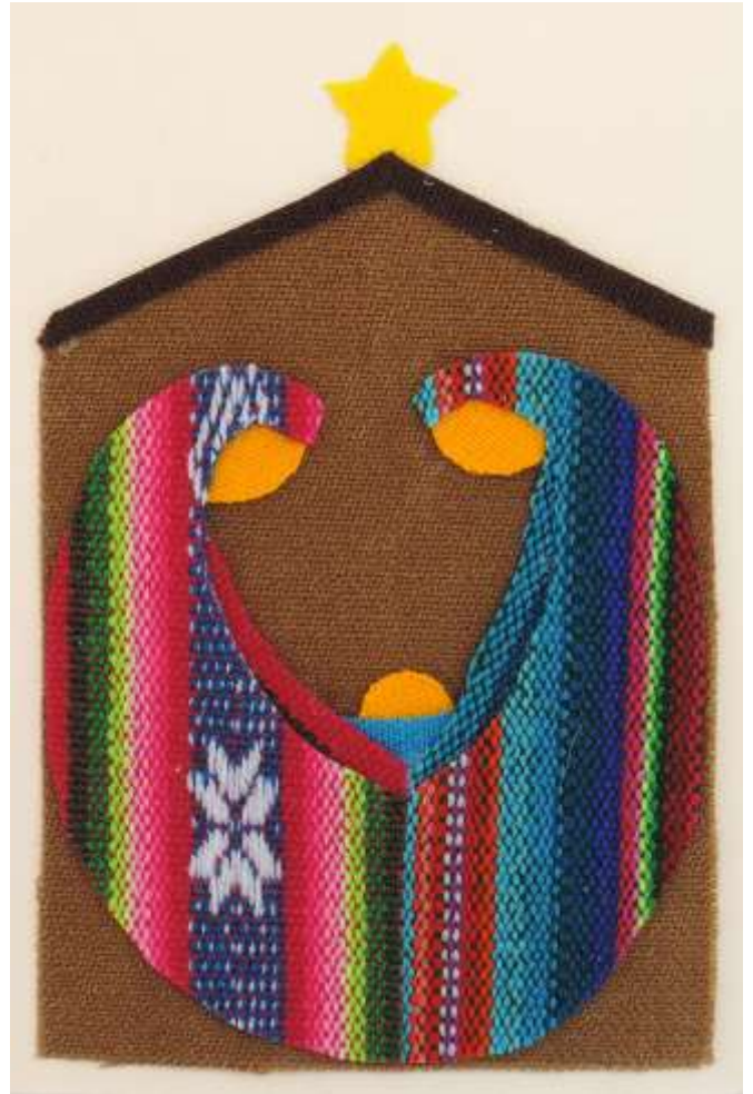
Motiv 15 Die heilige Familie