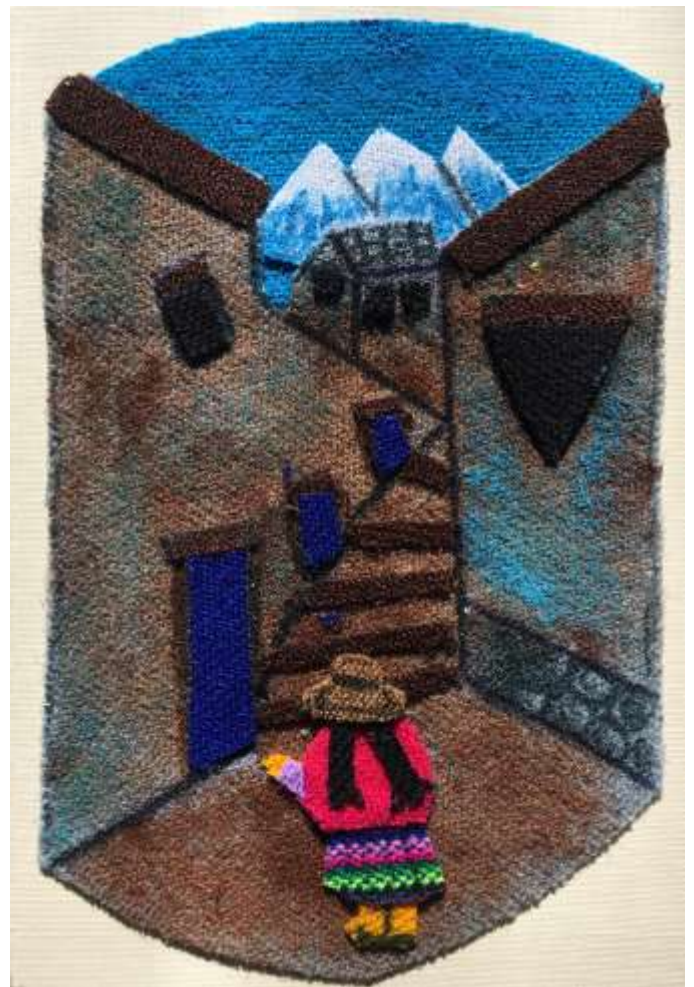
Motiv 40 La Paz