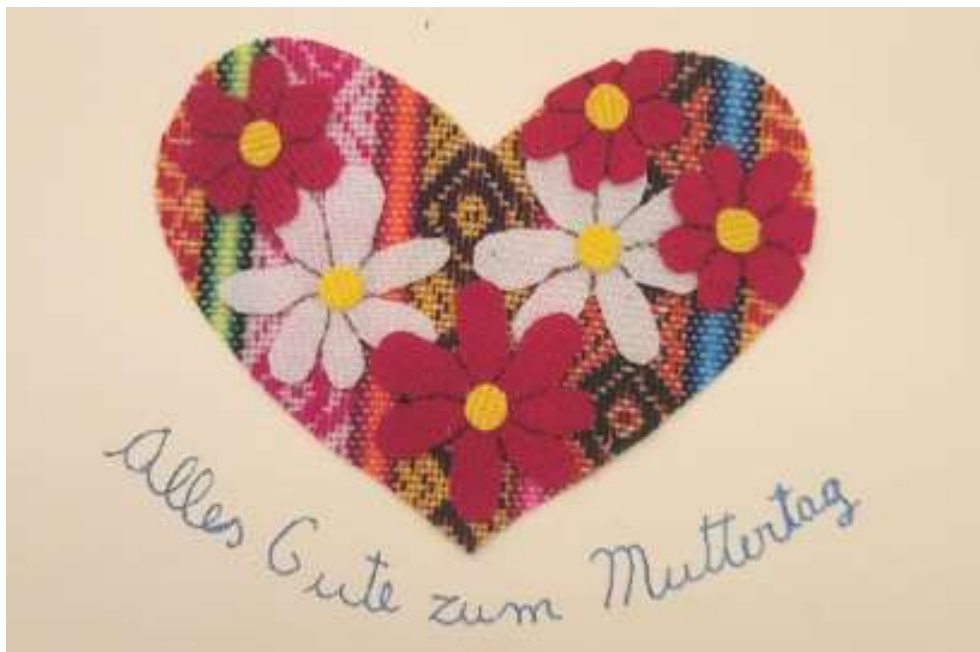
Motiv 67 Alles Gute zum Muttertag