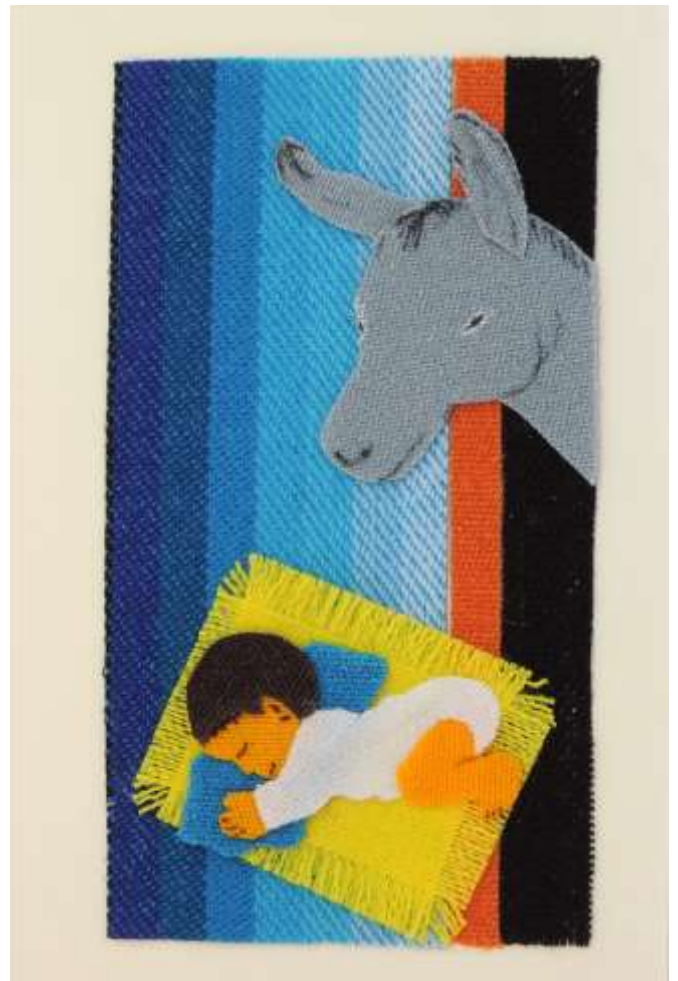
Motiv 18 Esel an der Krippe