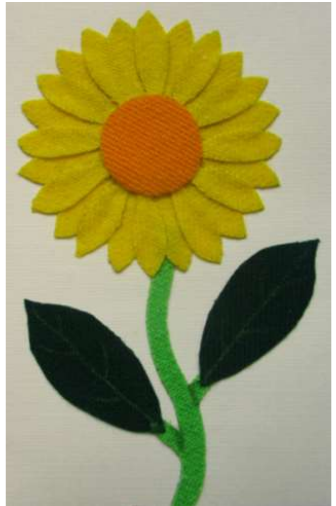
Motiv 52 Sonnenblume