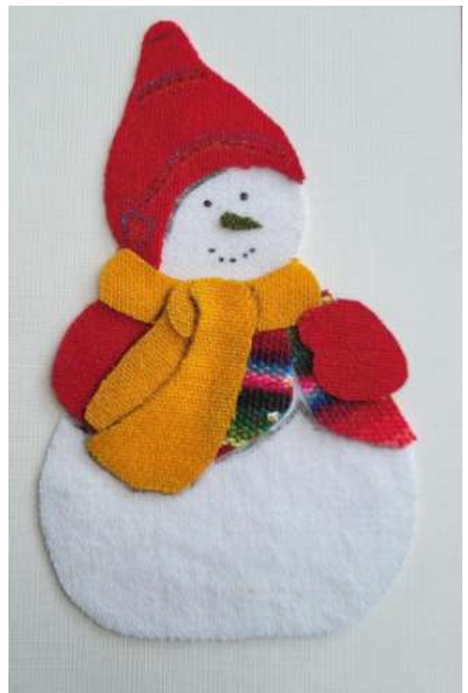
Motiv 30 Schneemann