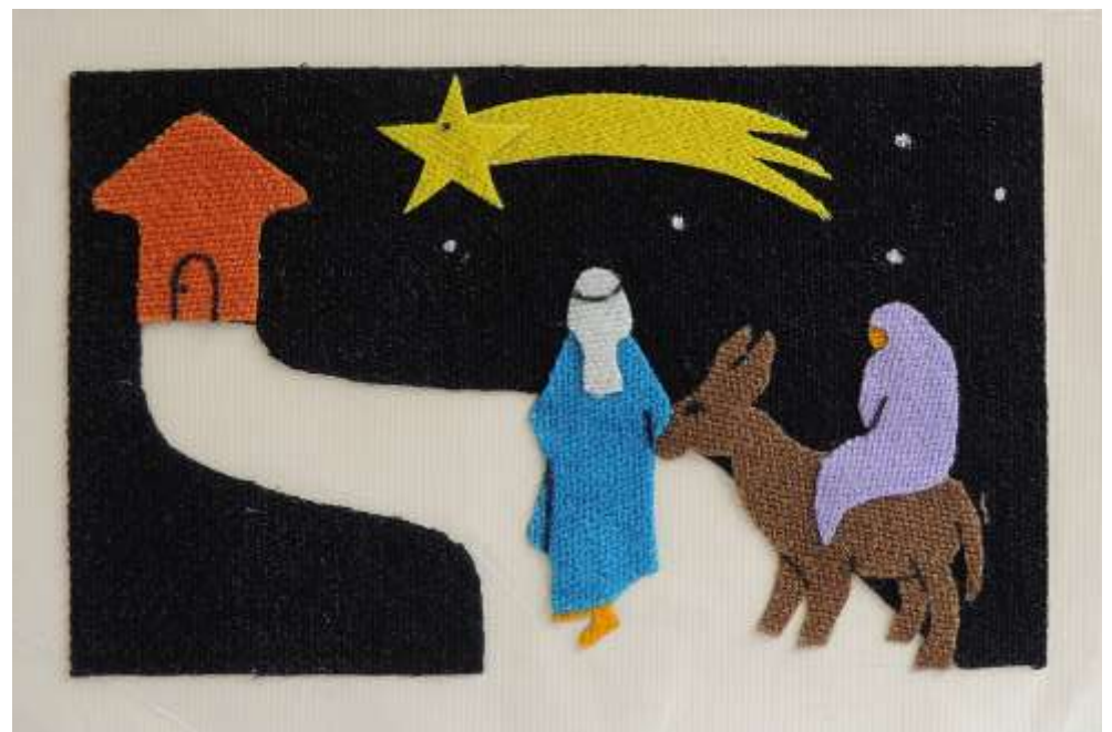
Motiv 8 Weg nach Bethlehem