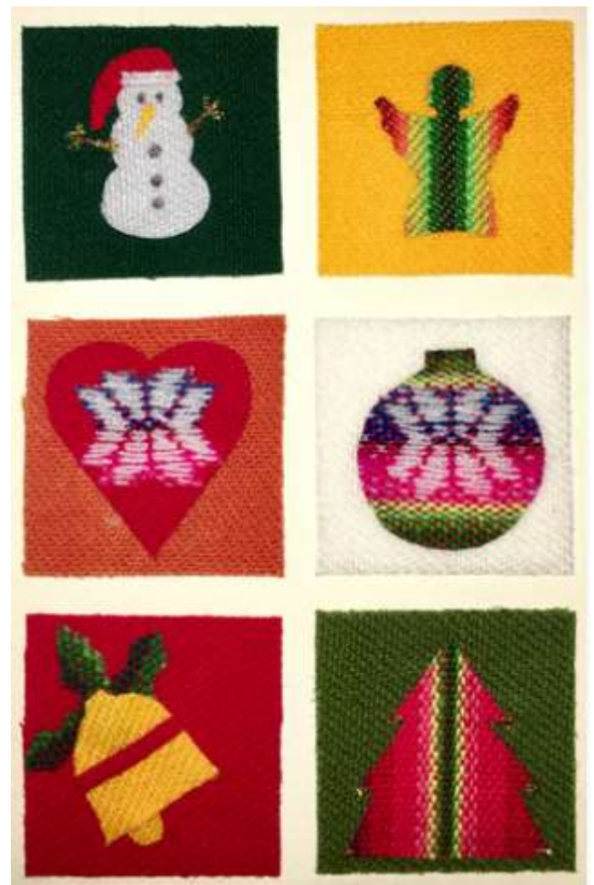
Motiv 4 Weihnachtsschmuck