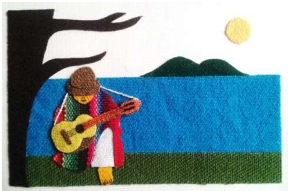
Gitarrenspieler aus dem Hochland am Titicacasee