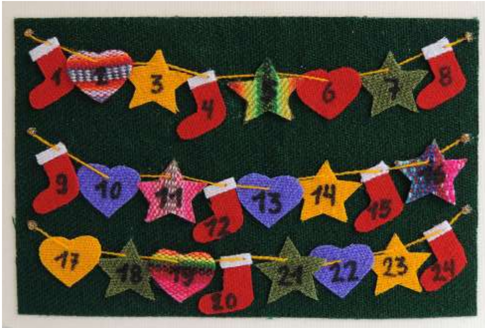
Motiv 3 Adventskalender