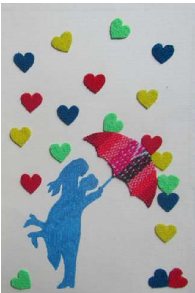
Motiv 77 Herzenregen