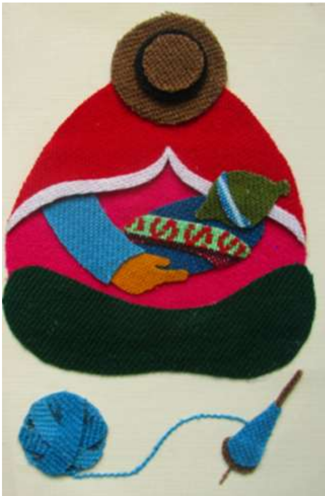
Motiv 44 Frau mit Kind und Spindel