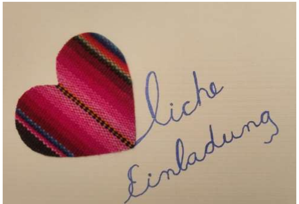
Motiv 57 Einladung