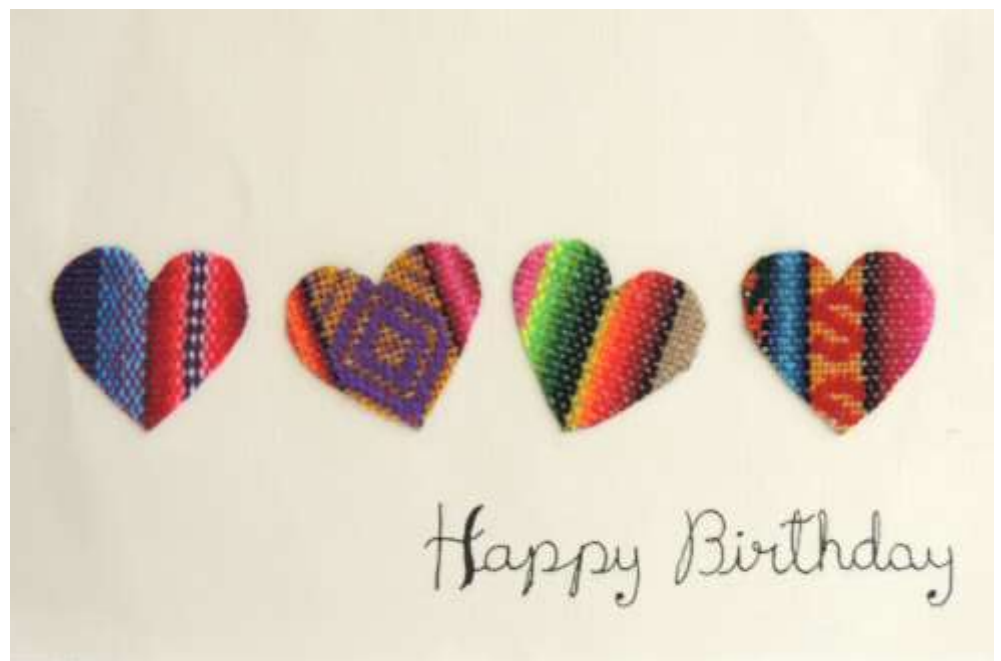
Motiv 63 Herzen zum Geburtstag