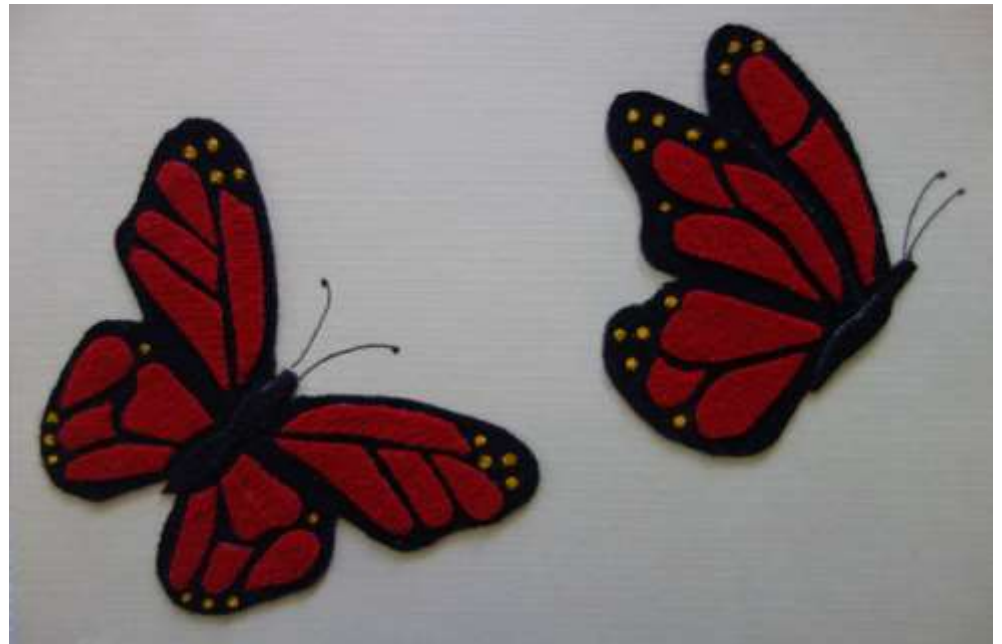
Motiv 50 Schmetterlinge