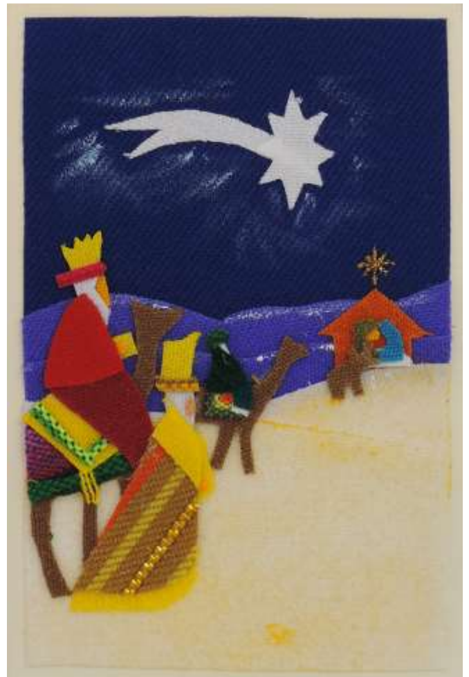
Motiv 22 Heilige 3 Könige vor der Krippe