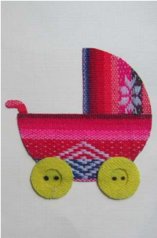
Motiv 56 Kinderwagen