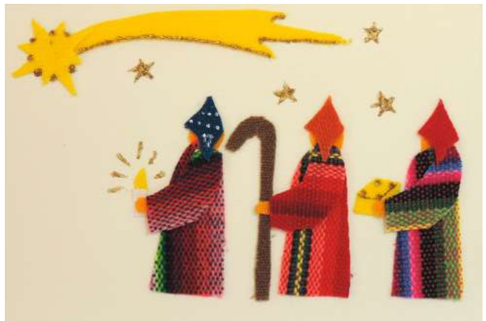
Motiv 20 Heilige drei Könige