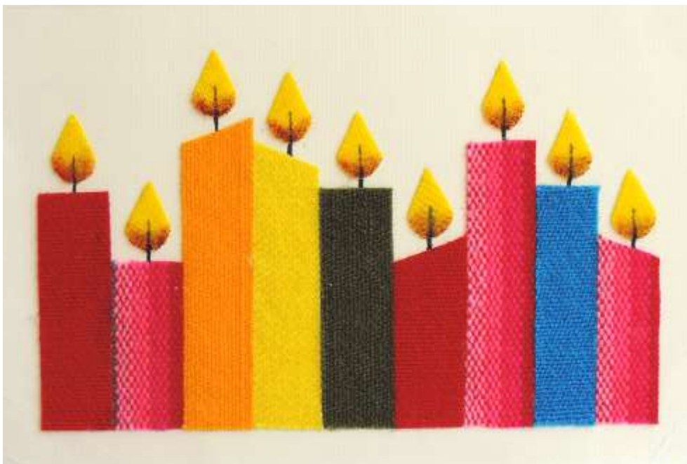
Motiv 59 Geburtstags- kerzen