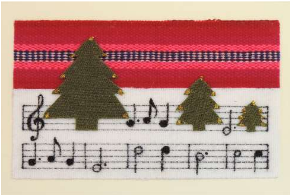
Motiv 19 Stille Nacht, heilige Nacht