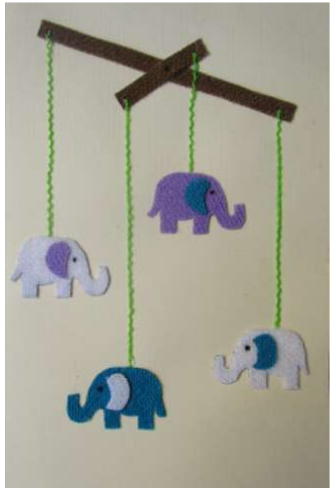
Motiv 55 Elefanten-Mobile