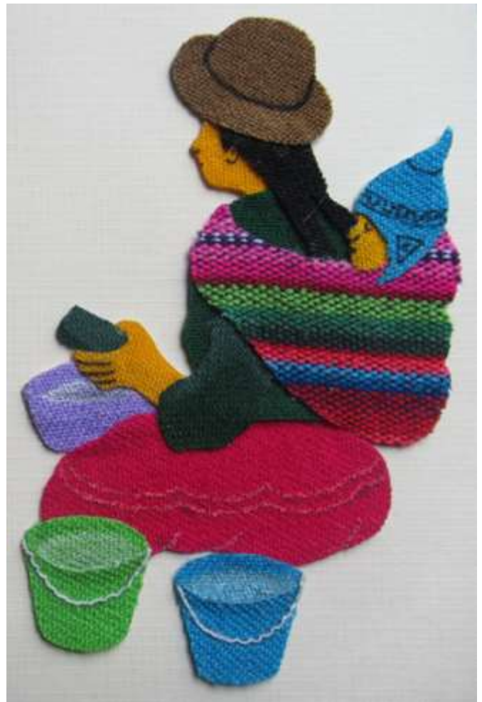
Motiv 45 Getränkeverkäuferin