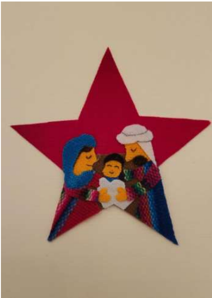
Motiv 17 Krippenstern