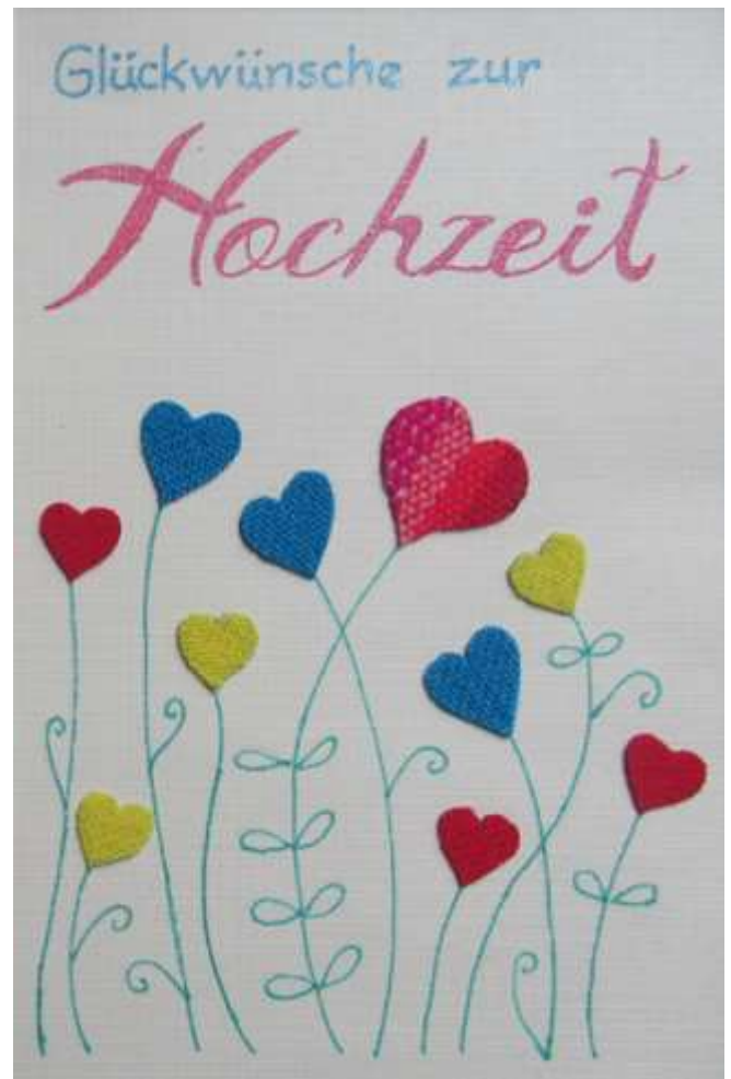
Motiv 76 Glückwünsche zur Hochzeit