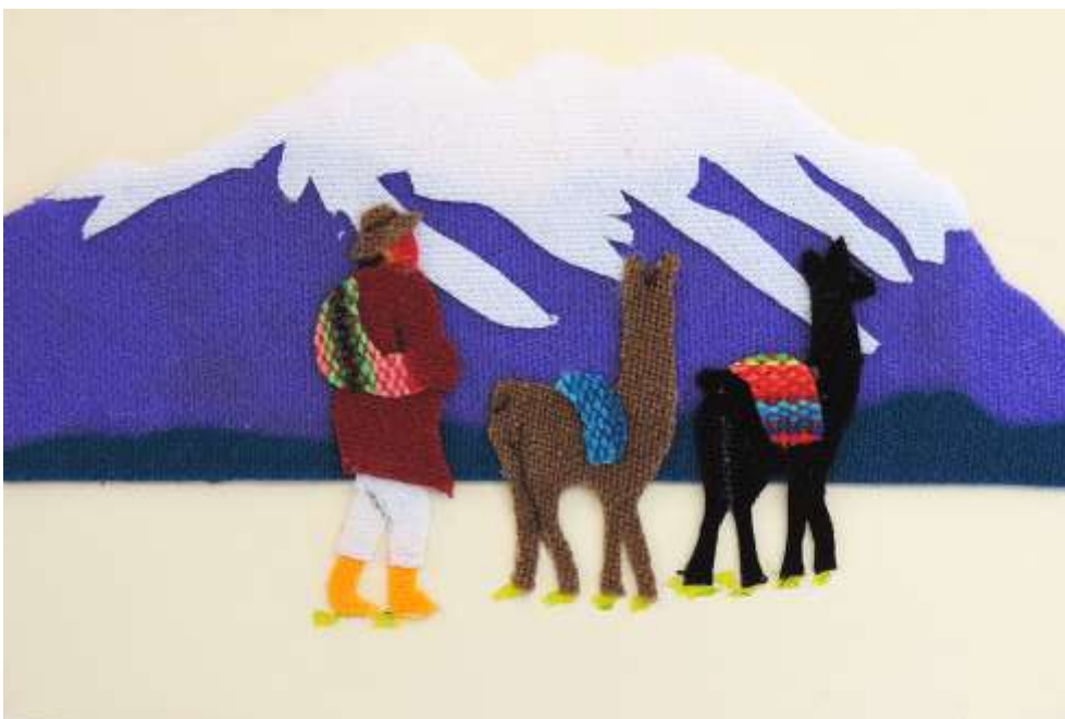
Motiv 38 Hirte mit Lamas