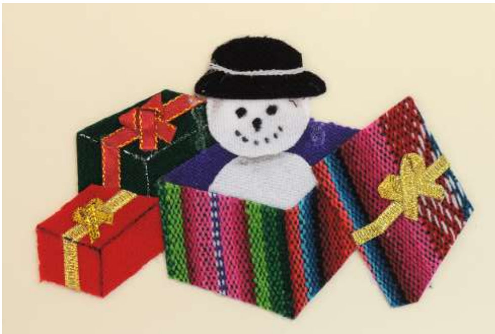
Motiv 29 Weihnachts- geschenke